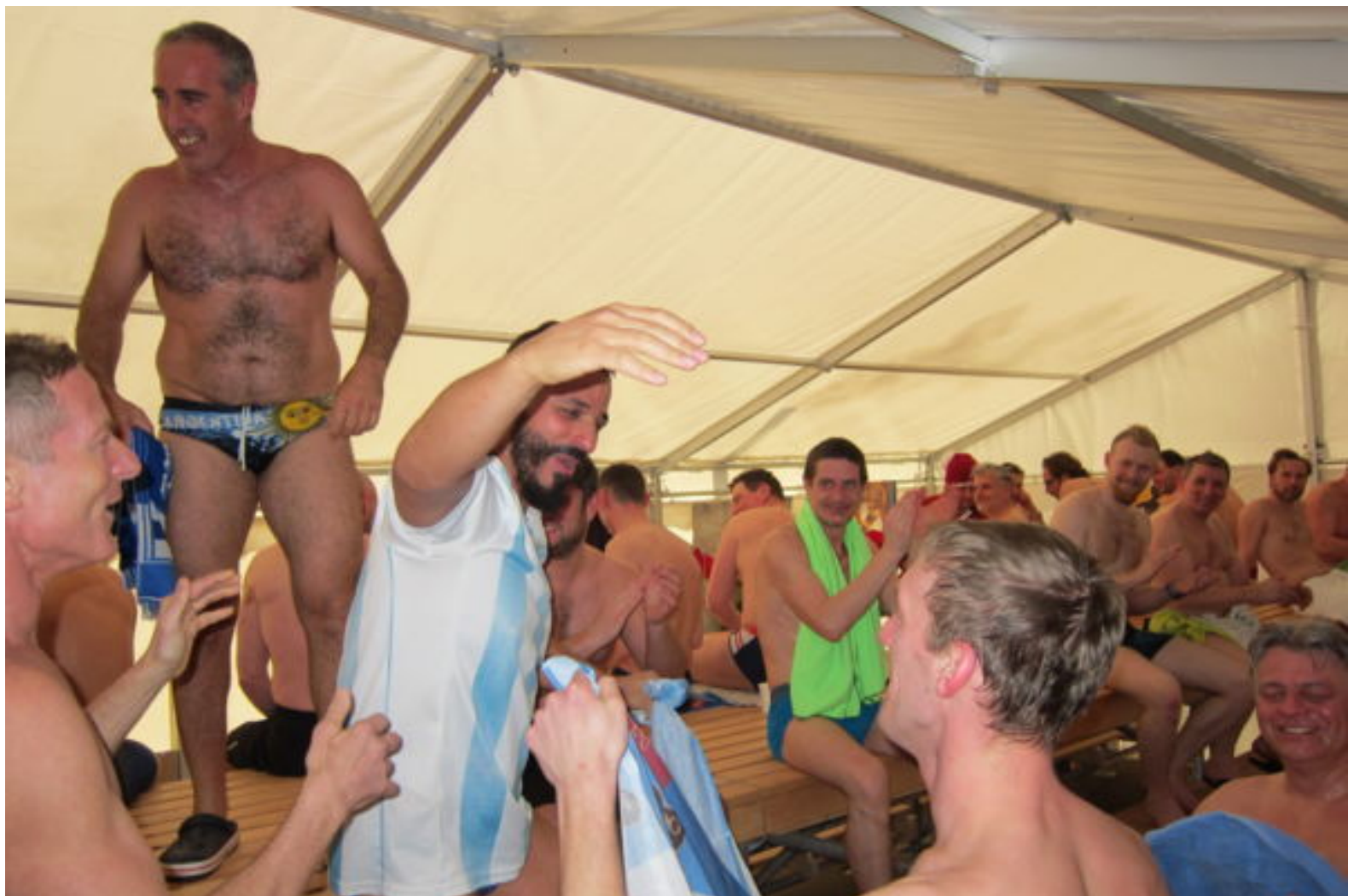
VM-deltagerne var vilde med at danse til både velkomstfest og gallamiddag – her anført af argentinere i den interimistiske sauna i et festelt.

Og jeg er åbenbart del af en dansker-trend: I 2012 var der tre danske deltagere til VM i Vintersvømning i Letland. Otte år senere er tallet 103. Næsten en tiendedel er således danske, her første uge af februar ved VM i Slovenien. I alt samles 1.065 vintersvømmere fra 36 lande om det kolde vand, og målt på deltagere var Danmark fjerdestørste nation efter Finland med 188, Storbritannien med 118 og Rusland med 104.